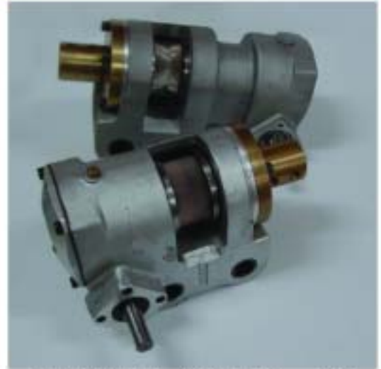
滚花轮齿轮箱—新或翻新件，备件